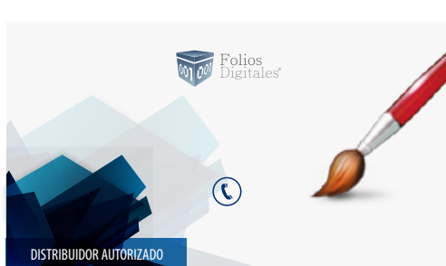
tarjetas de presentación